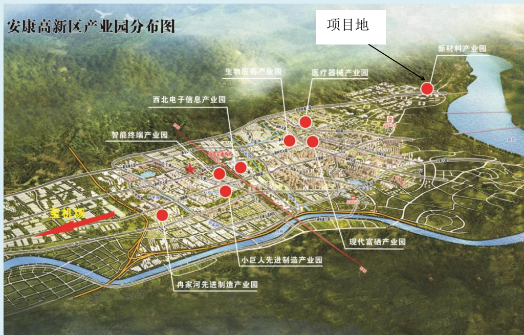
图1.1 本项目与高新区规划符合性分析示意图